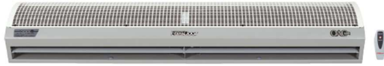
Isıtıcısız Hava Perdesi