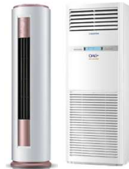
OLE-24 FSDSM / OLE-48 FSDCHM-T