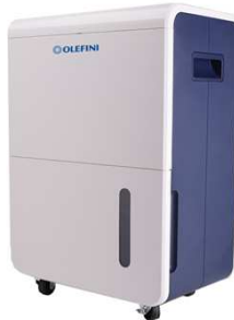
OL55-585E &amp; OL70-585E