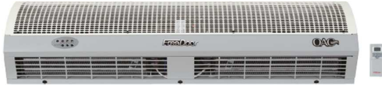
Isıtıcılı Hava Perdesi